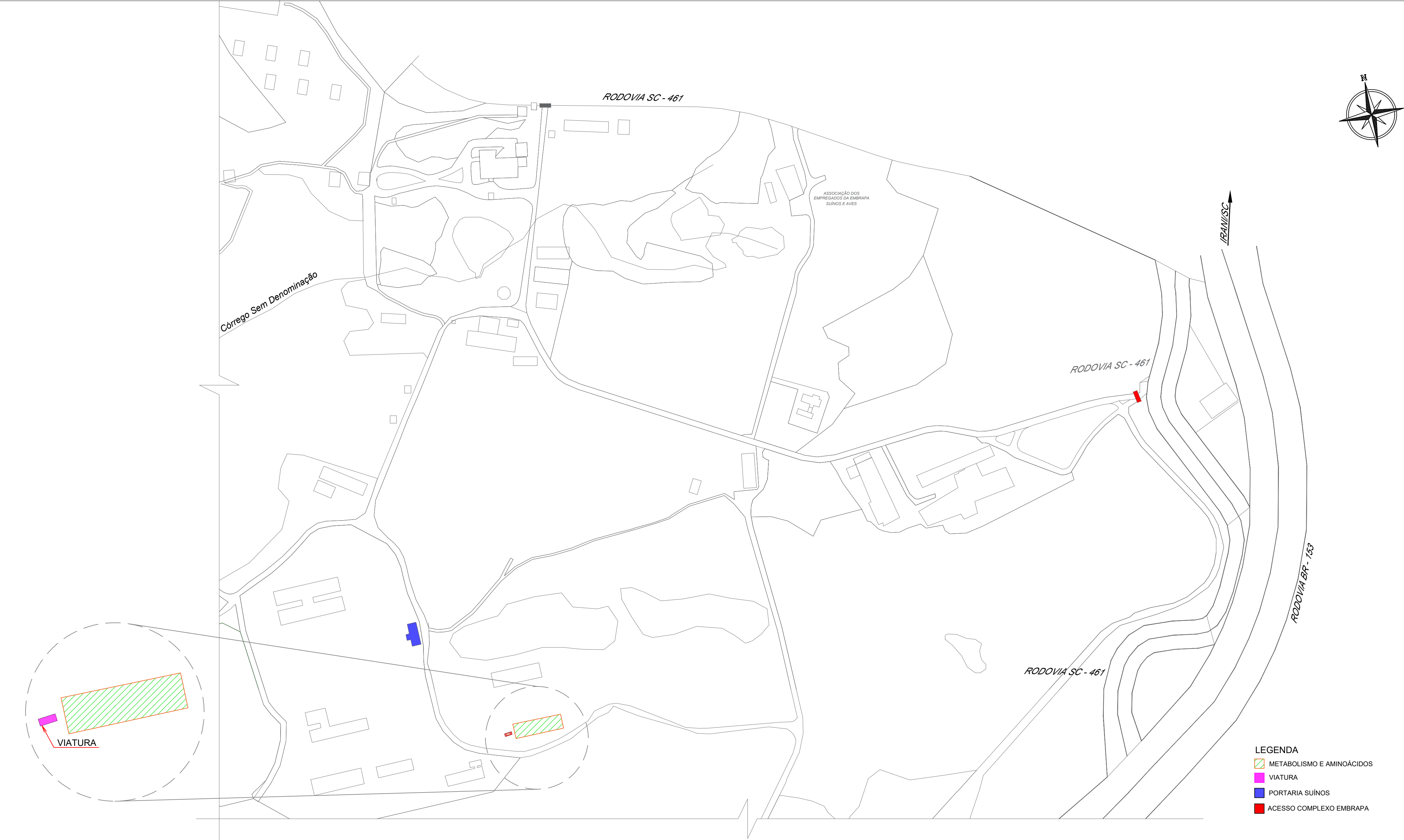
PLANTA DE SITUAÇÃO ESCALA.: 1/5000